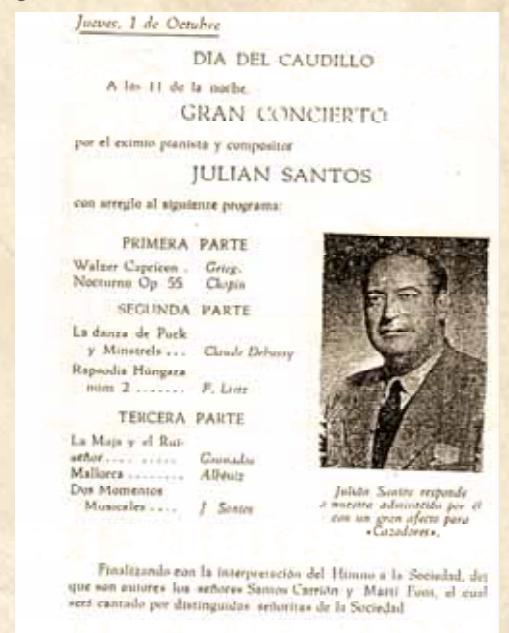
Programa del concierto en la Sociedad Recreativa de Cazadores. Yecla 1953

Poseía partituras de Liszt, como la Campanella y las Rapsodias húngaras n° 2 y n° 7 ; de Debussy, La mer , Estampas , Imágenes ; Sonatas de Haydn; de Chopin tenía Estudios , Preludios , Valses , Baladas ; de Grieg, Cuadros poéticos y Piezas líricas ; de Smetana, Tabor ; piezas de Scriabin, Bela Bartok, de Ravel, de Schumann y de los compositores españoles, algunas piezas de Granados, entre ellas Goyescas , y de Albéniz, Asturias , Granada y, lo más importante, la Suite Iberia , en la que trabajó muchos años analizándola y revisándola de manera brillante.