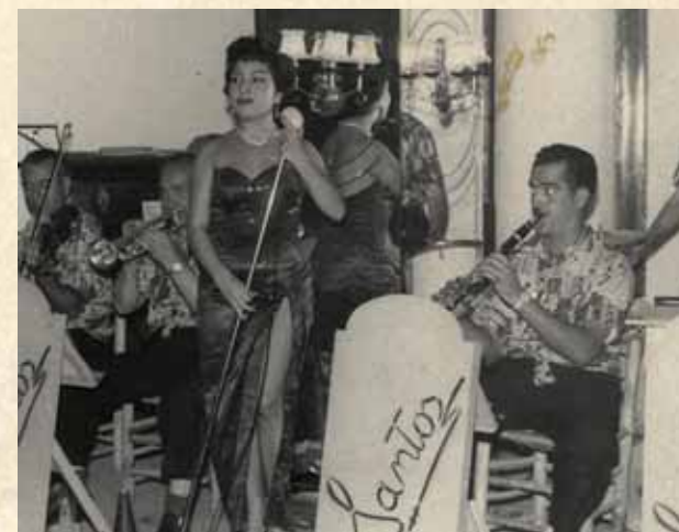
Verbena, años 60

Has de saber que todos estos años mi vida ha sido ingunta y laboriosa. Llegué a dar conciertos de piano en Cajas de Ahorros, Institutos, Casas Culturales. Tuve compañías líricas estrenando obras mías. He formado artísticamente a muchos alumnos que hoy son directores