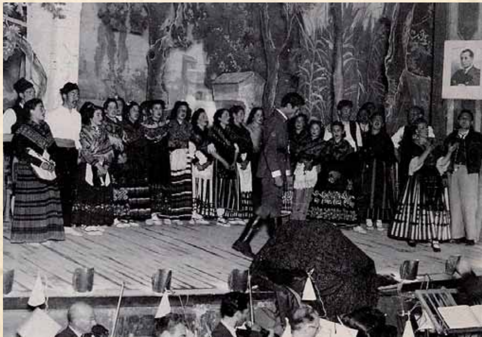
Estreno de La moza de la Dehesilla en el Teatro Vico, 1946

Un año más tarde, el 19 de noviembre de 1947, La moza de la Dehesilla se estrena en el Teatro Romea de Murcia 40 y el 24 de noviembre, en el teatro Cervantes de Abarán 41 .