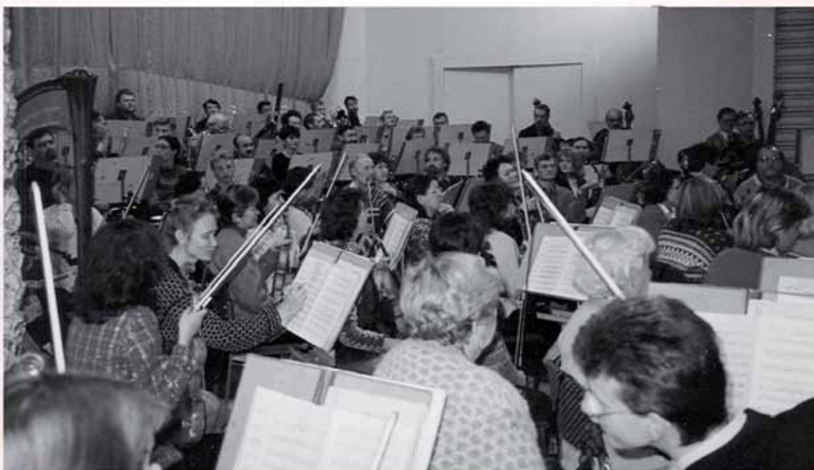
Ural Philharmonic Orchestra. Grabación de "La Niña del Boticario" Ekaterimburgo (Rusia), septiembre 2000