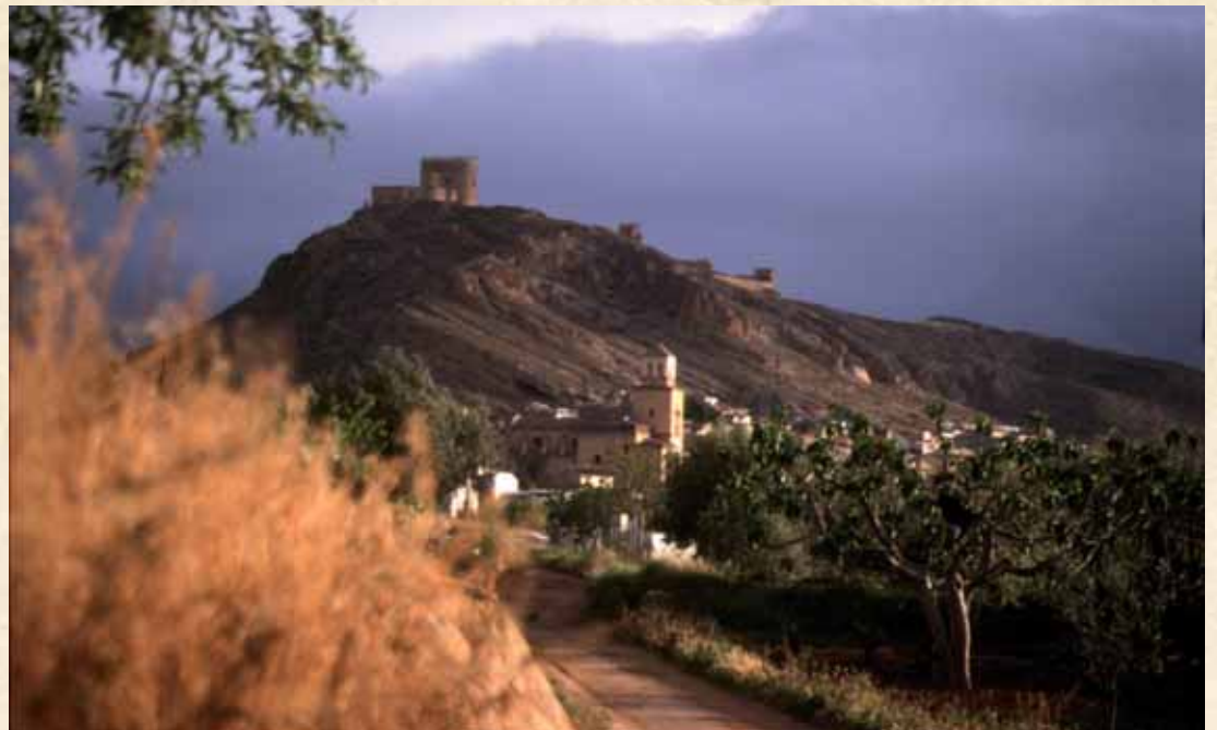
Jumilla en los años 50, abajo a la derecha imagen actual