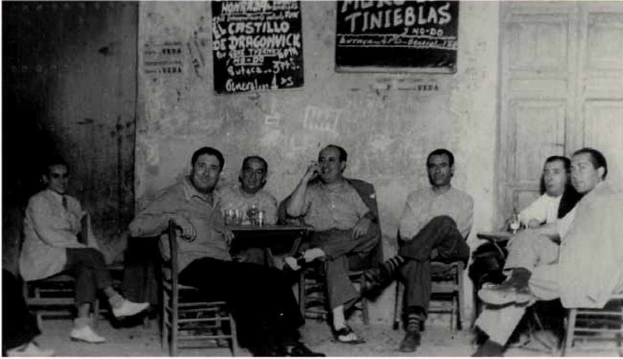
Tertulia en el Bar Molinero