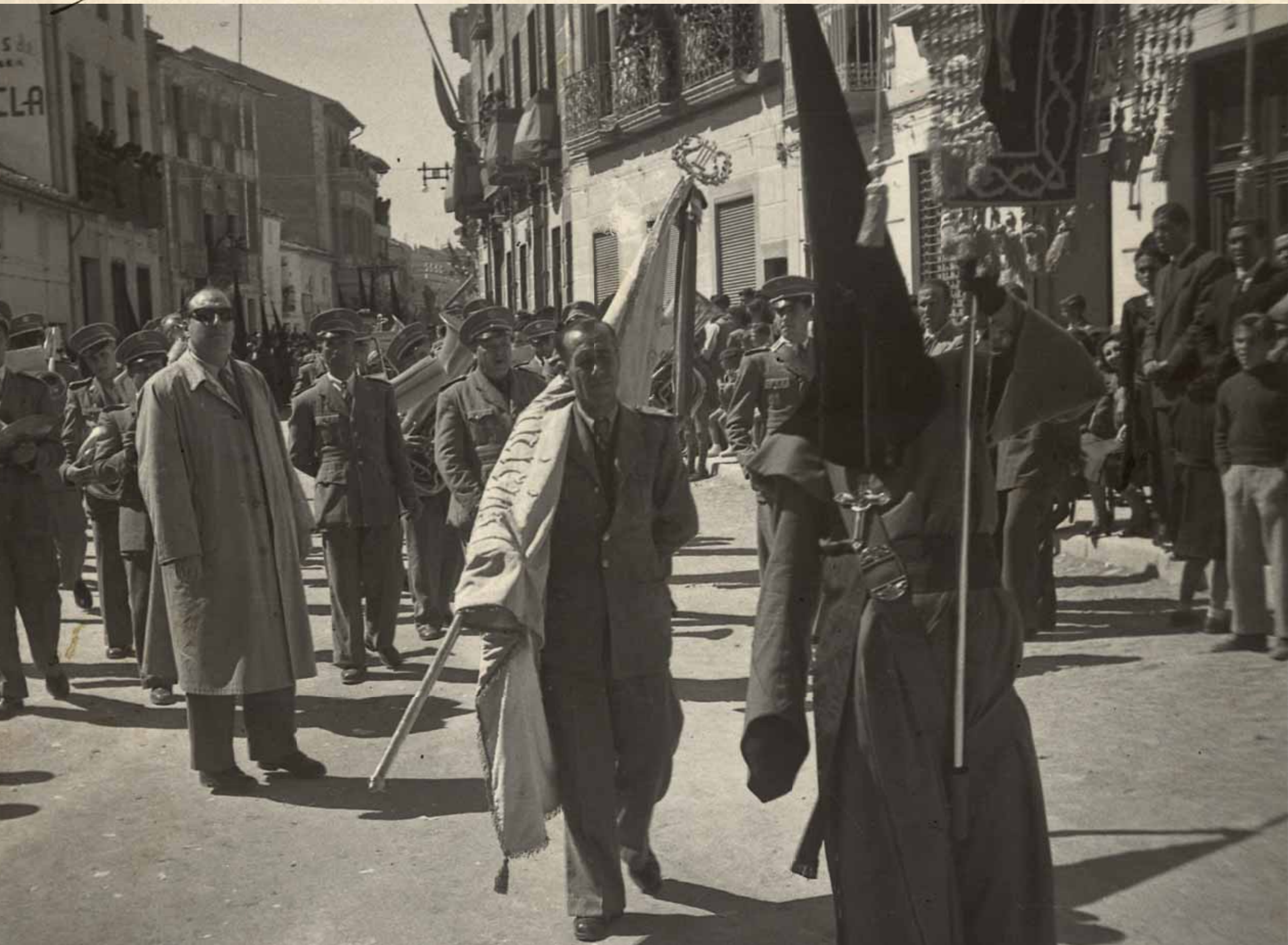
Procesión del Calvario a su paso por la Calle Cánovas del Castillo, año 1953