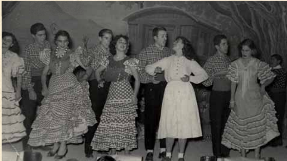
Estreno de Farruca , 10 de abril de 1953