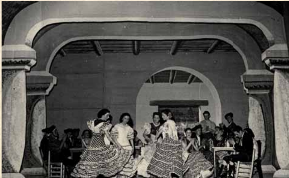
Estreno de Farruca , 10 de abril de 1953