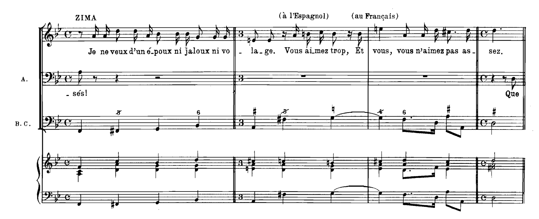
Scene IV._ZIMA, DAMON, ALVAR, ADARIO

Adario sortant avec vivacité de la forêt, Zima, charmée de son transport, lui présente la main.