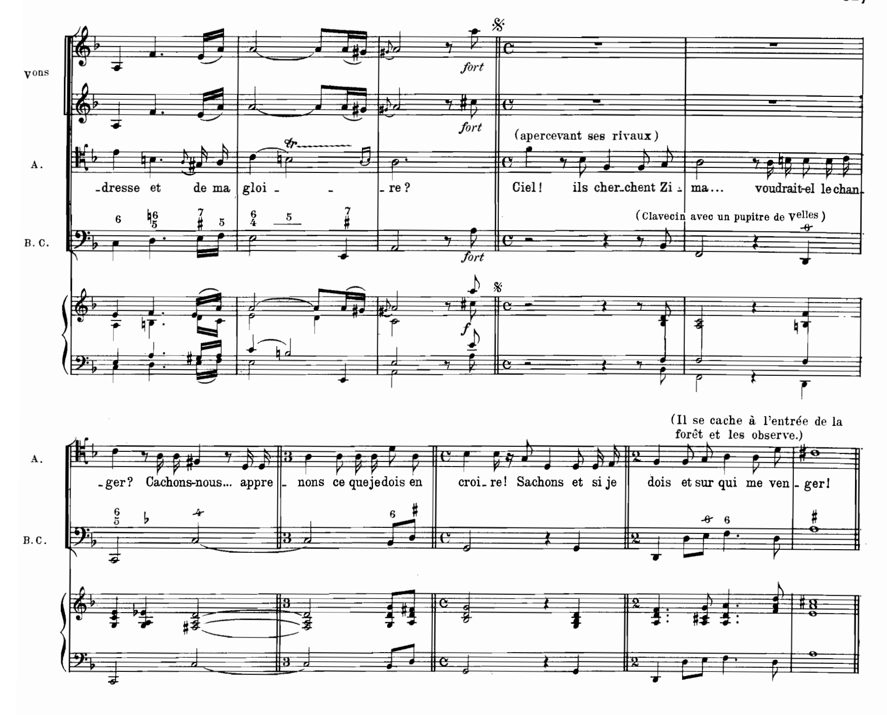
Scène II. - DAMON, officier français, DON ALVAR, officier espagnol, ADARIO, caché.