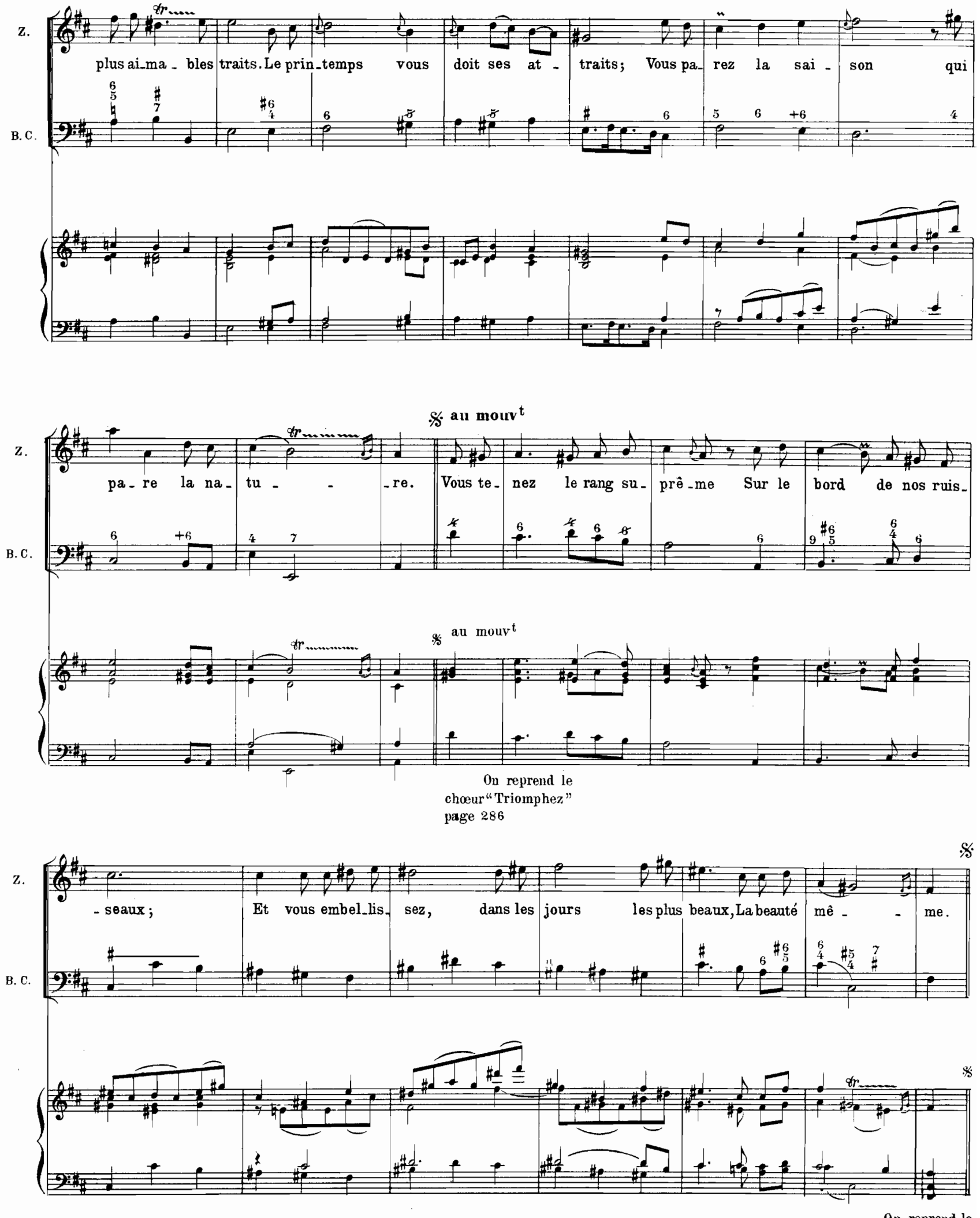
On reprend le chœur" Triomphez" page 286