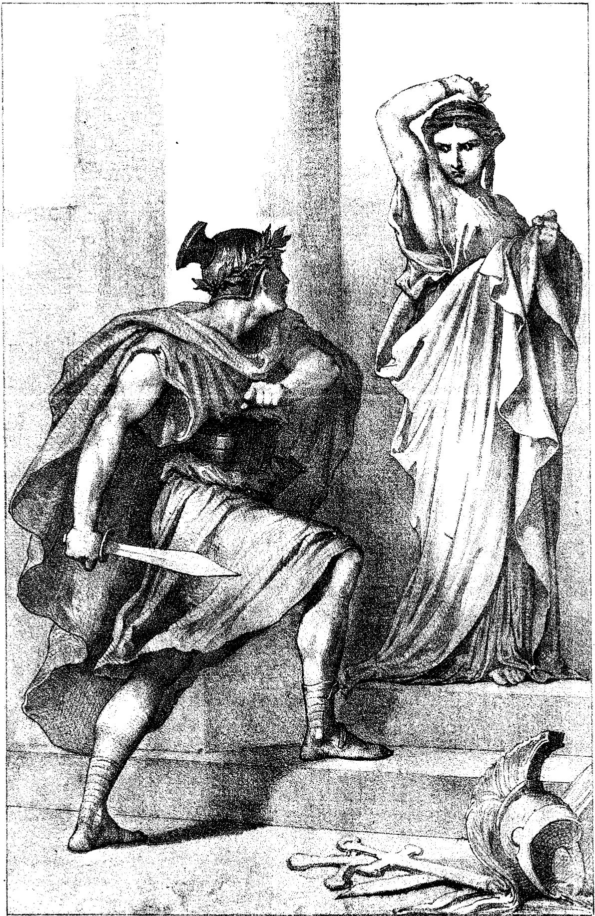
CHAZAL INV. LAMBERT-LITH.