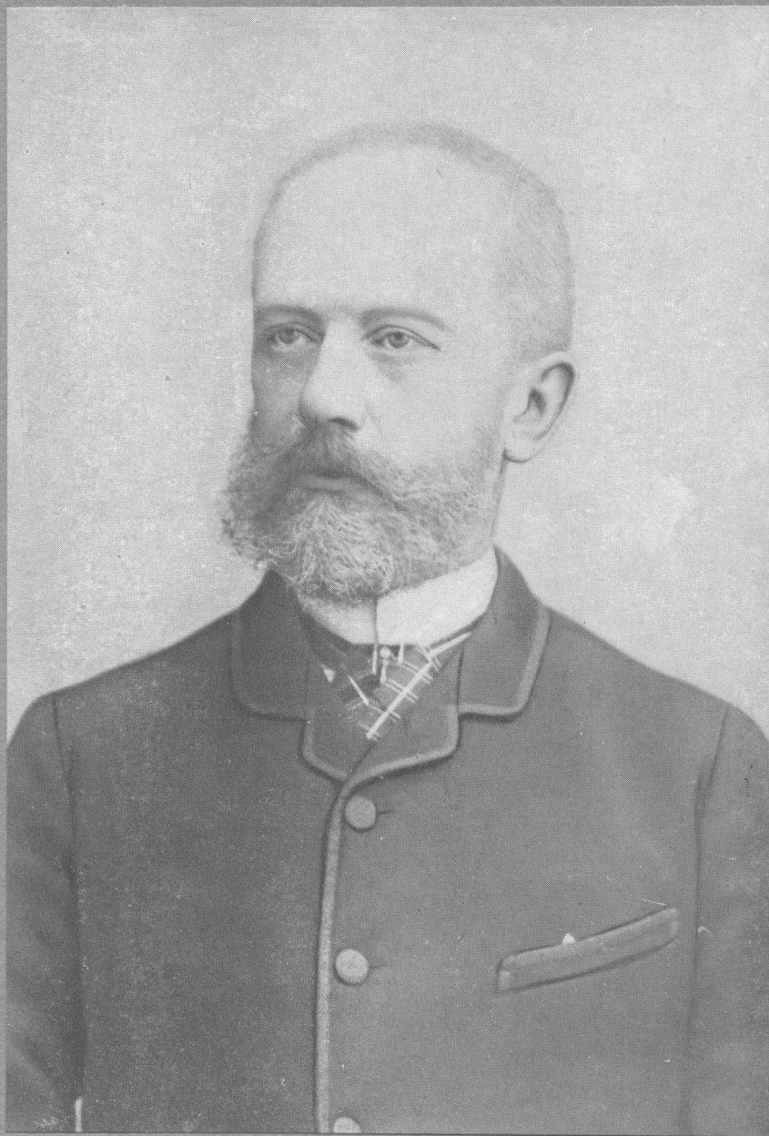
ПЕТР ИЛЬИЧ ЧАЙКОВСКИЙ