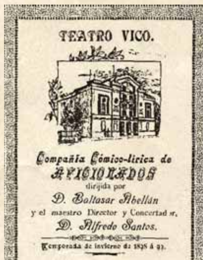
Detalle del anverso de la Programa de la temporada de invierno entre 1898 a 1899

Con esta representación no se acabó la recaudación de fondos, sino que la Junta Benéfica siguió contando con la Compañía Cómico-Lírica de Aficionados para representar ocho actuaciones más. Se trataba de una serie de espectáculos teatrales para la temporada de invierno