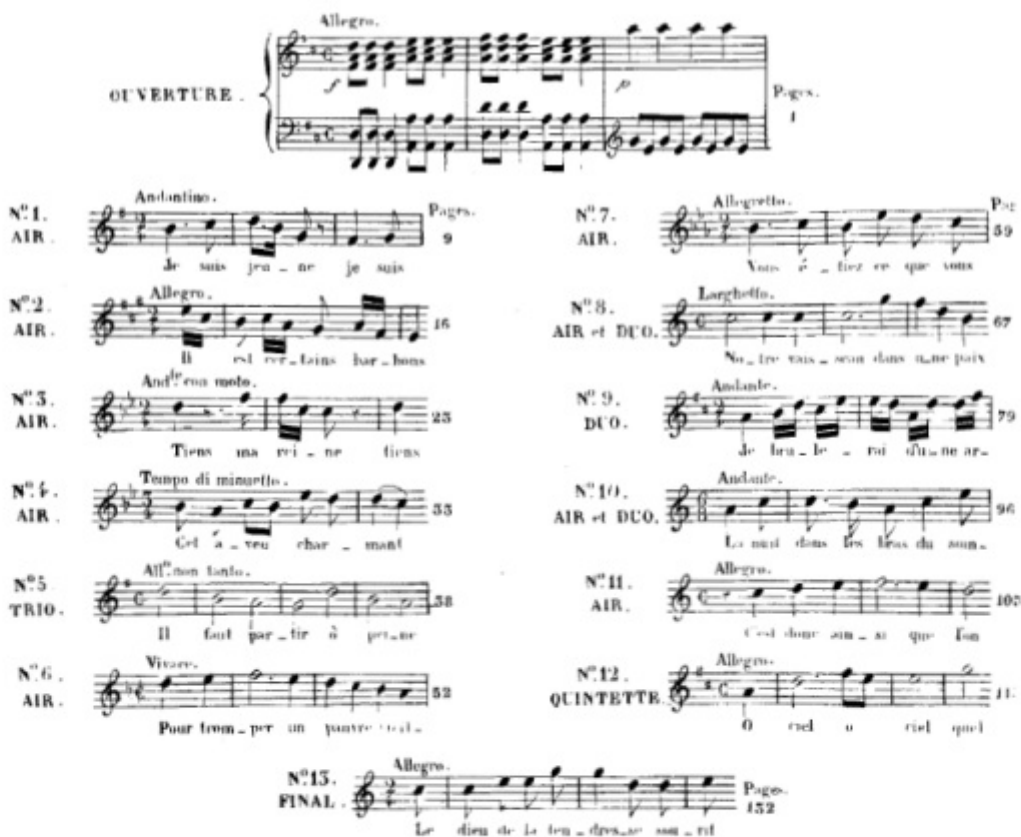
TABLE THÉMATIQUE :

LEANDRE . . . . Tenor. PIERROT . . . . Tenor.