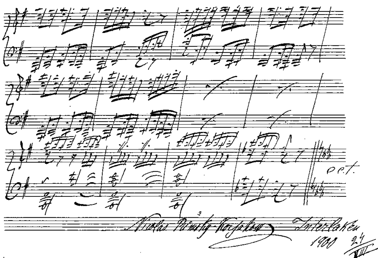
MANUSCRIT AUTOGRAPHE DE RIMSKY-KORSAKOW, LE GRAND MUSICIEN RUSSE DONT L'OPÉRA COMIQUE VIENT DE REPRÉSENTER UN CHEF-D'ŒUVRE, Snegourotschka .