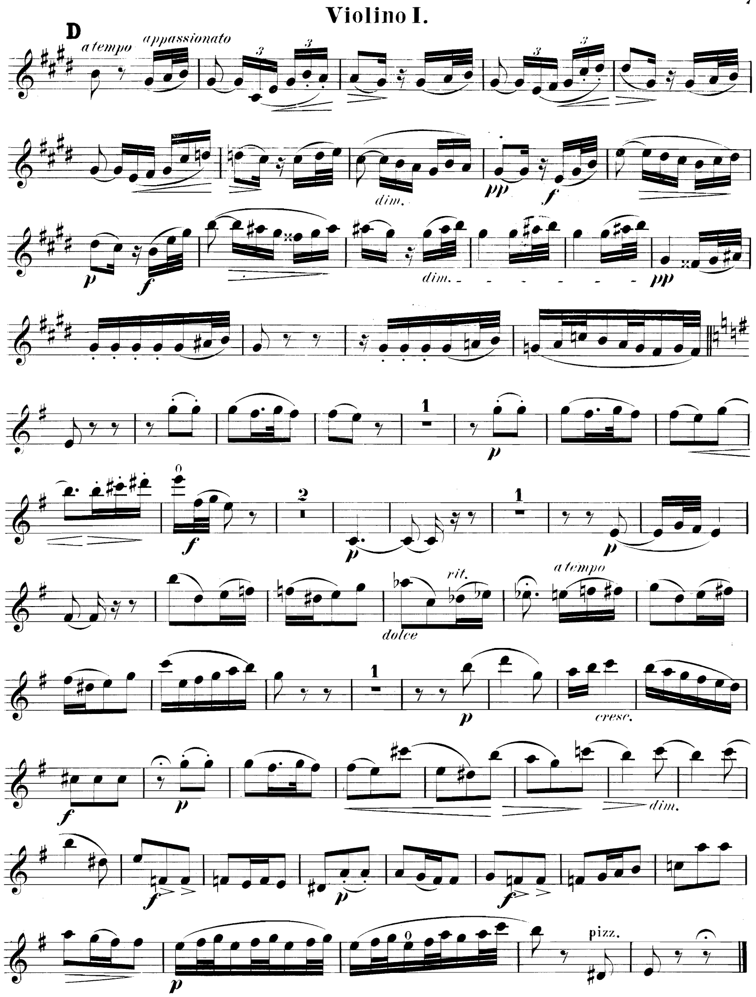
J. 1652 H.