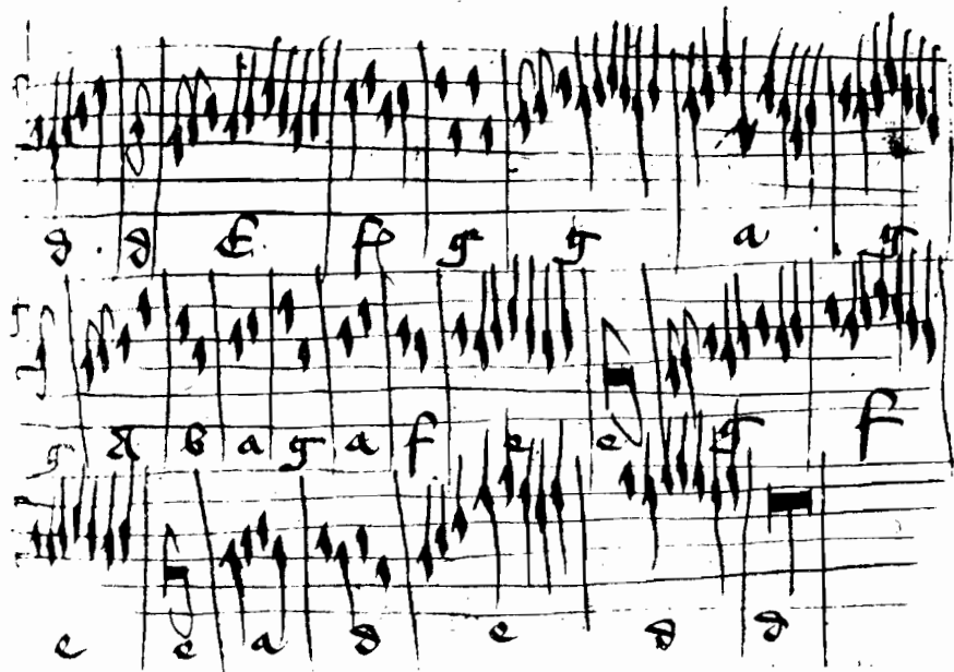
Deutsche Orgeltabulatur aus der Zeit um 1430. Liedbearbeitung: Wol vp ghesellen (Schluß). Berlin, Pr. Staatsbibliothek Ms. theol. lat. quart. 290, Bl. 57r.